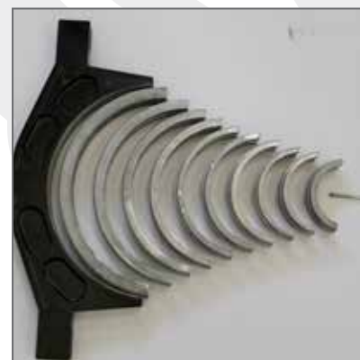
Riduzione a pacco \ Reductions in pack