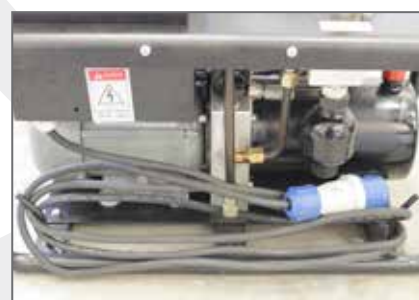
Avvolgicavo \ Cable reel