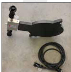
Termoplastra \ Heater