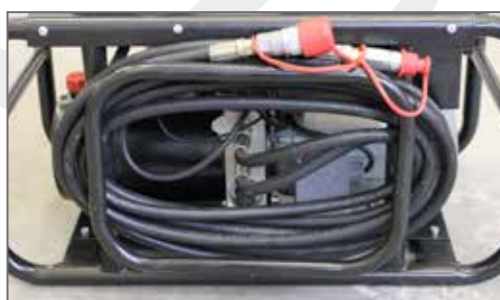
Avvolgitubo \ Hose reel