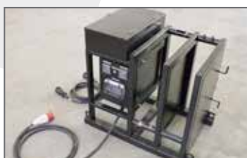
Supporto \ Chassis