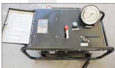
Unità sinottica \ Synoptic unit