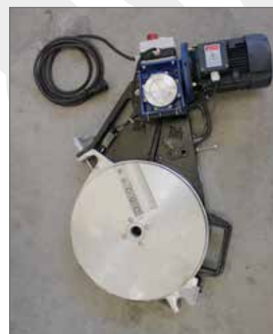
Fresa elettroidraulica \ Electro-hydraulic cutter