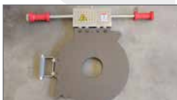
Termoplastra \ Heater