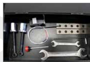
Cassetta attrezzi \ Tools box