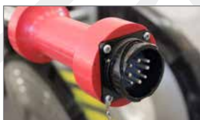
Innesto rapido \ Quick connector